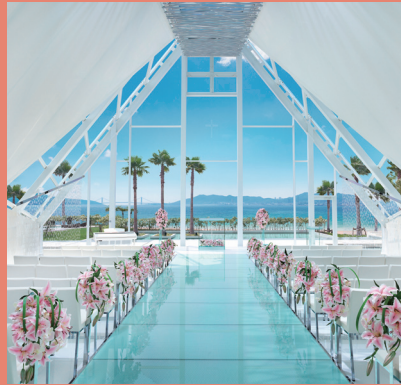
【チャペルブルービジュア】

(コンサート参加費、ラヴィマーナアネックスパチャでの特別ディナー&ワンドリンク付) ※ワンドリンク以外お帰りの際にご精算ください